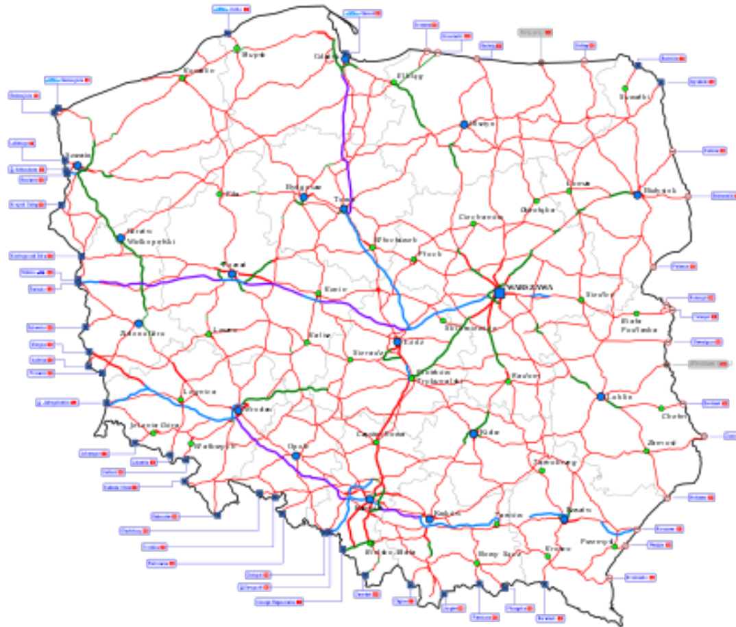
Karte des Landesstraßennetzes auf dem Gelände Polens, Stand November 2014

Repräsentanz der Saarländischen Wirtschaft in Polen