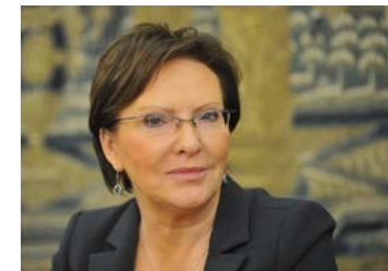
Ewa Kopacz Premierminister